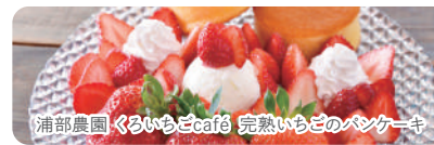
浦部農園 くらいらとcafé 完熟いちごのパンケーキ

落花生やさつまいも・苺・梨など旬の果物が盛り沢山の千葉県はスイーツの宝庫です。あなたのお気に入りを探しませんか。