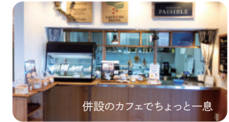
併設のカフェでちょっと一息