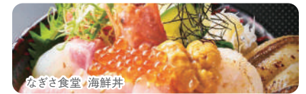
なぎさ食堂 海鮮丼

新鮮な海の幸は海に囲まれた千葉県グルメの定番。各地域の海産物を食べ歩くのもおすすめです。