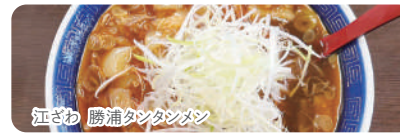
江ざわ 勝浦タンタンメン

竹岡式ラーメン、勝浦タンタンメン、アリランラーメンなど地域性豊かな千葉県のご当地ラーメンがあります。ぜひご賞味ください。