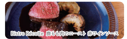
Bistro Récolte 鹿もも肉のロースト 赤ワインソース

捕獲から適切な施設での処理・加工までを県内で行ったシカやイノシシ肉「房総ジビエ」。ぜひご賞味ください。